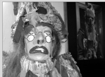
jedna z masek