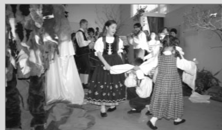
folklorní soubor Padoláček