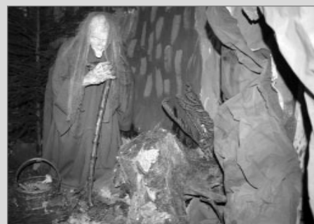
démon hor permoník