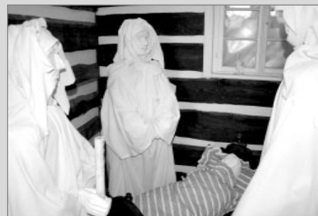
sudičky děmoni osudu