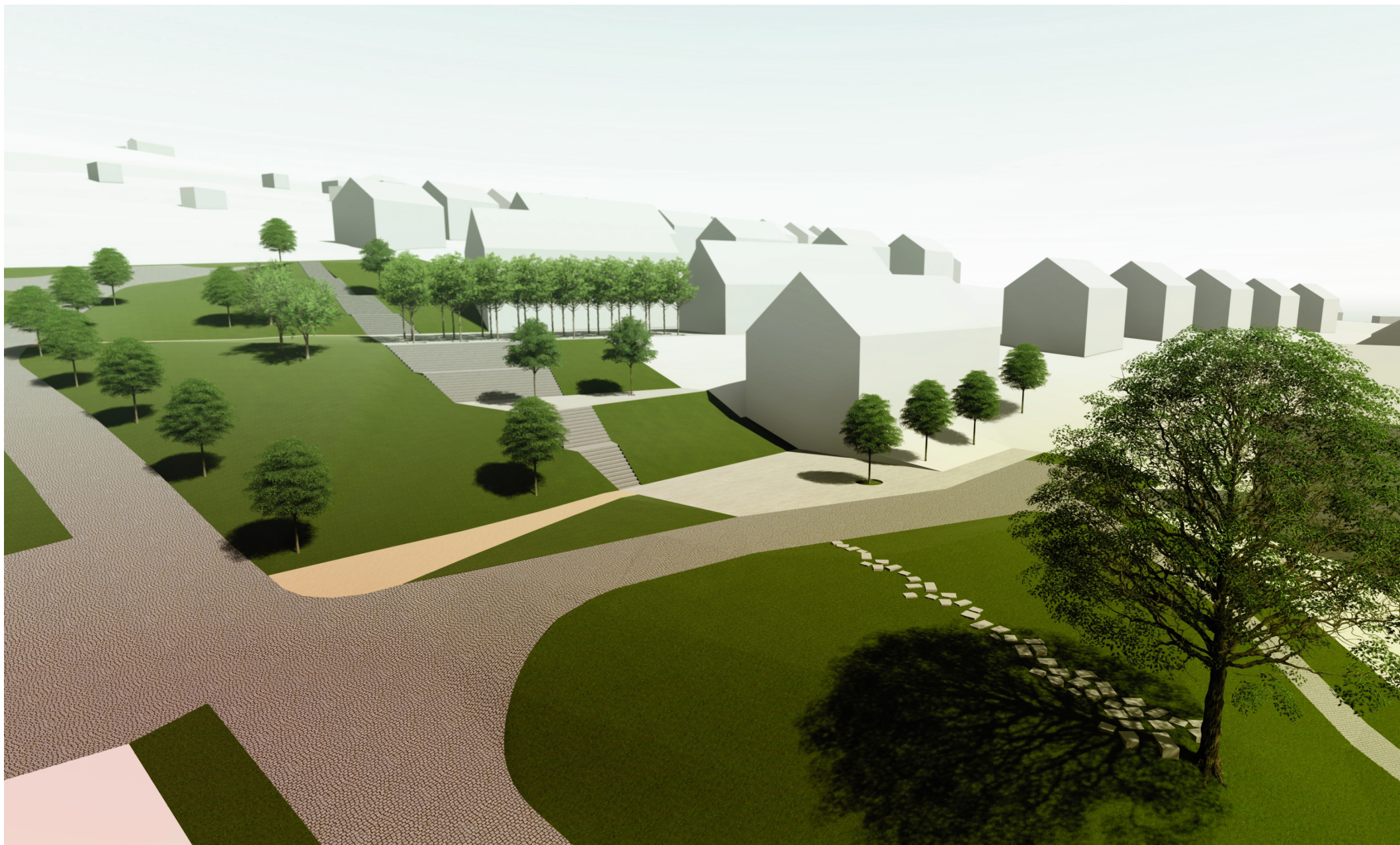
detail "C" - předprostor plochy občanské vybavenosti