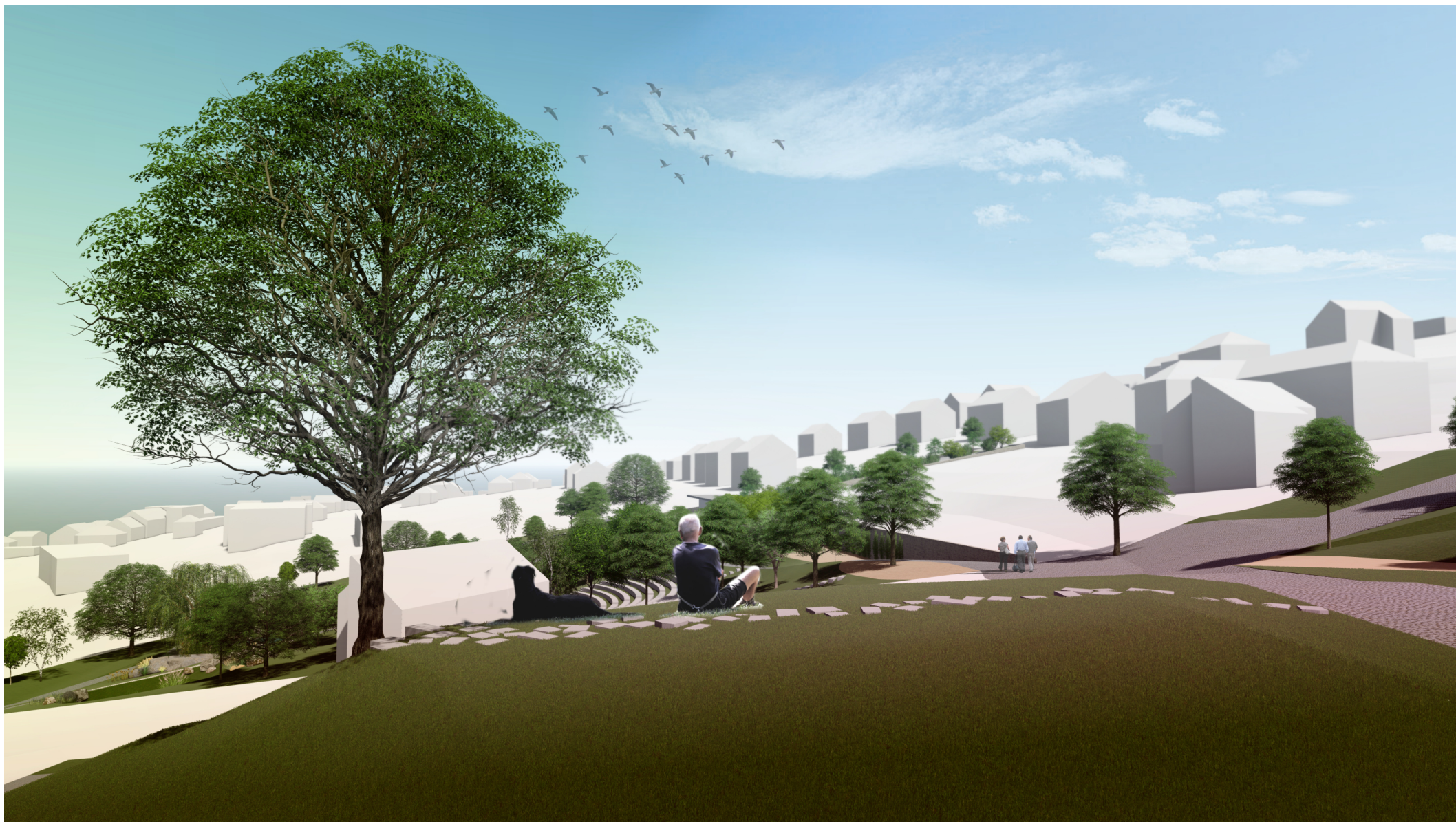
detail "C" - předprostor plochy občanské vybavenosti