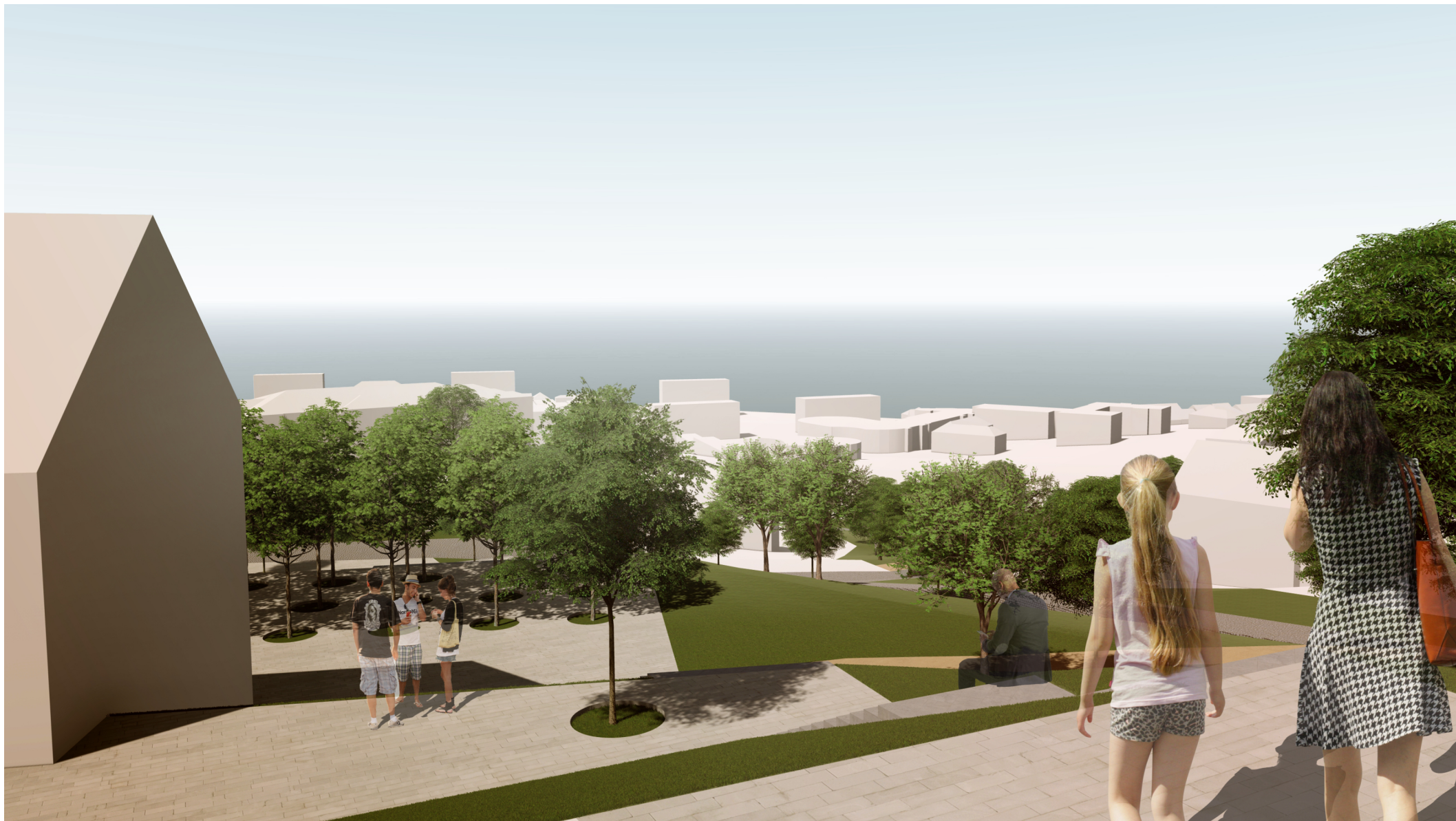
detail "C" - předprostor plochy občanské vybavenosti